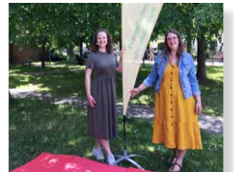
Familienzentrum „Emma u. Paul“