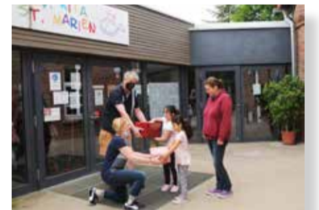
Arbeit mit Geflüchteten