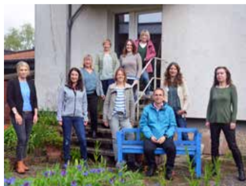
Lebensberatungsstelle in Langenhagen