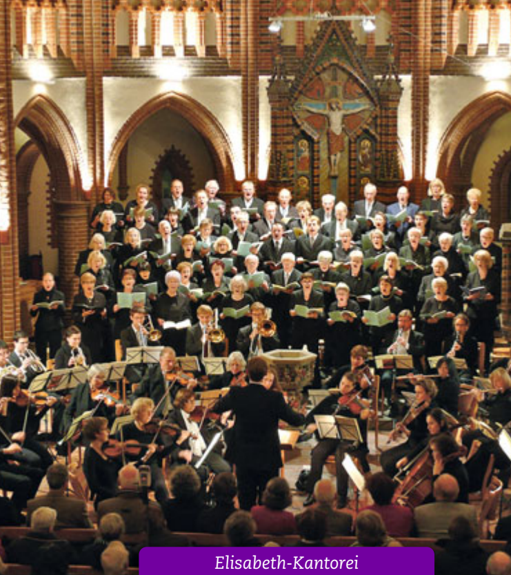
Elisabeth-Kantorei MUSIK ZUR STERBESTUNDE JESU am 25. März

So_13 10 Uhr St. Petri-Kirche Großburgwedel HEINRICH SCHÜTZ – MATTHÄUSPASSION