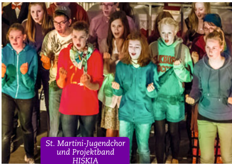
St. Martini-Jugendchor und Projektband HISKIA am 29.April