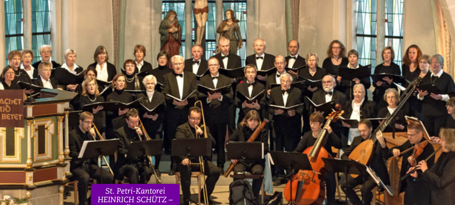
St. Petri-Kantorei HEINRICH SCHÜTZ – MATTHÄUSPASSION am 13.März