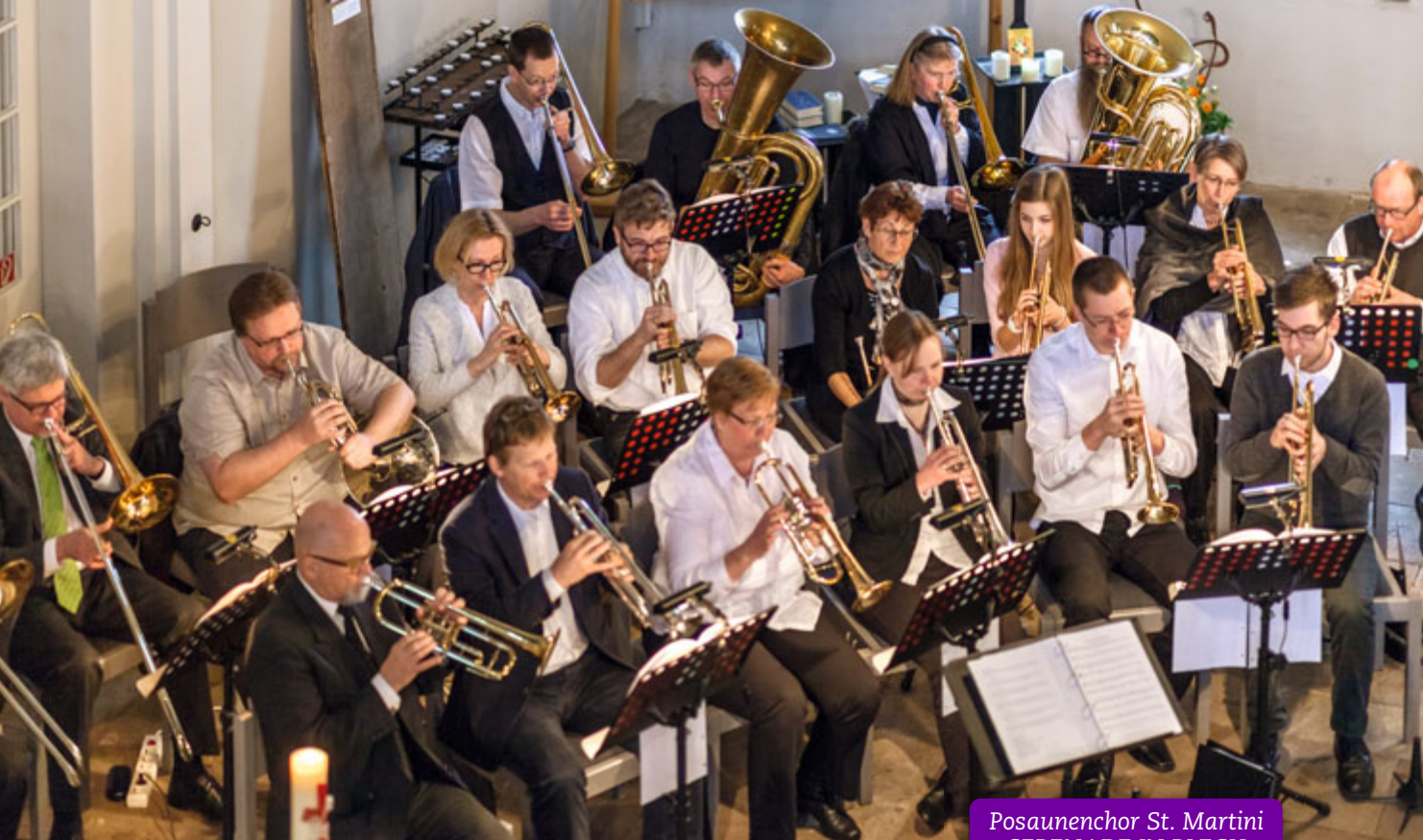
Posaunenchor St. Martini SERENADE IN BLECH am 12.Juni

So_10 17 Uhr Elisabeth-Kirche Langenhagen