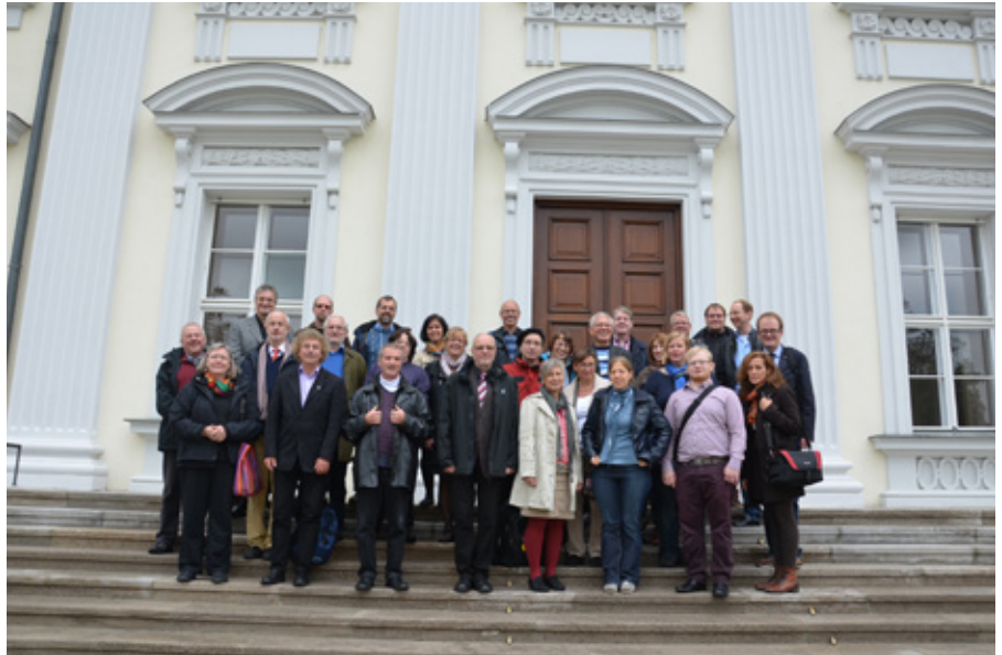
Bis ins Vorzimmer des Bundespräsidenten gelangten die Besucherinnen und Besucher aus dem Kirchenkreis Burgwedel-Langenhagen im Schloss Bellevue.