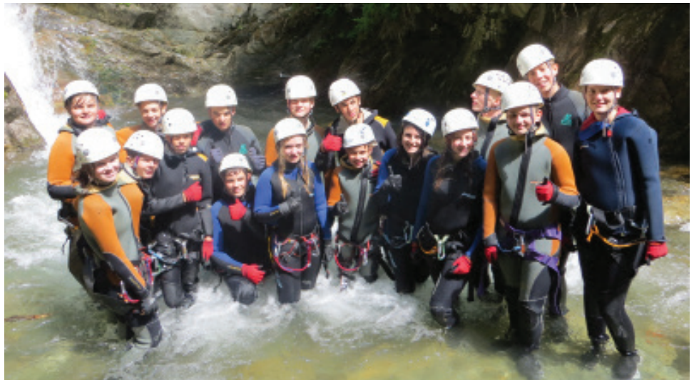
Riverrafting und Canyoning gehörten zu den besonderen Attraktionen während der Freizeit.

Die 37. Südtirol-Freizeit findet übrigens vom 21. August bis zum 3. September 2014 statt – natürlich wieder auf dem Gruberhof in St. Jakob.