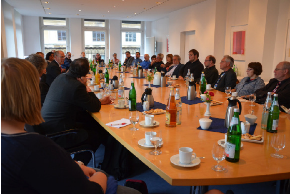
Kirchendiplomatie im Sinne der institutionellen Interessen der evangelischen Kirche: Gespräch im Ratssaal im Haus der EKD am Gendarmenmarkt.

wahre Gauck bewusst Distanz zu explizit kirchlichen Themen; er wolle das Wort vom „Pastor der Nation“ nicht noch zusätzlich befördern.