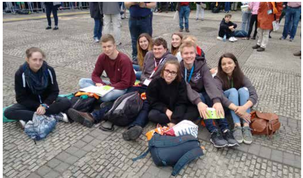
Warten auf den Beginn des Eröffnungsgottesdienstes ...

Vorträge interessierten; sich unter anderem mit dem Thema Christen in der AfD auseinandersetzten. Am Abend standen dann die Konzerte von Max Giesinger und den Wise Guys auf dem Programm.