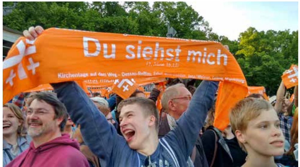
„Dieses Gefühl gibt es nur beim Kirchentag“: gute Stimmung bei den Jugendlichen aus dem Kirchenkreis.