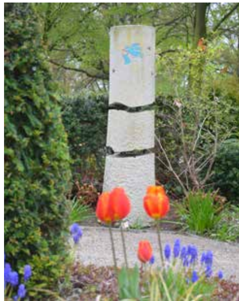
Eine Stele auf dem Gräberfeld erinnert an die Sternenkinder.

Um den Garten der Sternenkinder dauerhaft abzusichern, wurde vor einigen Jahren die Stiftung Sternenkinder gegründet, eine Treuhandstiftung der Bürgerstiftung Langenhagen. Friedhofsgärtnereien, Bestatter und