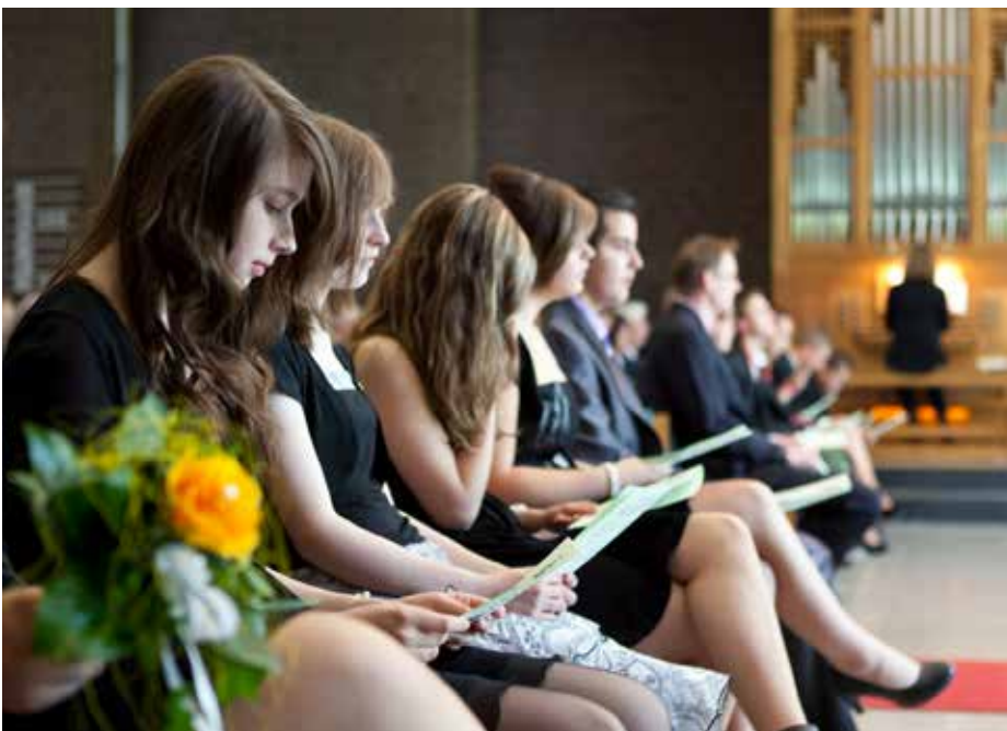
Ab einem Alter von 14 Jahren dürfen junge Menschen sich in ihren Kirchengemeinden an der Wahl der Kirchenvorstände beteiligen.

Die nächste Wahl der Kirchenvorstände ist am 11. März 2018. Durch die Absenkung des aktiven Wahlrechtes von 16 auf 14 Jahre erhöht sich die Gesamtzahl der Wahlberechtigten in der hannoverschen Landeskirche um geschätzte 29.000 Mitglieder. Das passive Wahlrecht, also die Möglichkeit, selbst in den Kirchenvorstand gewählt zu werden, bleibt bei 18 Jahren.