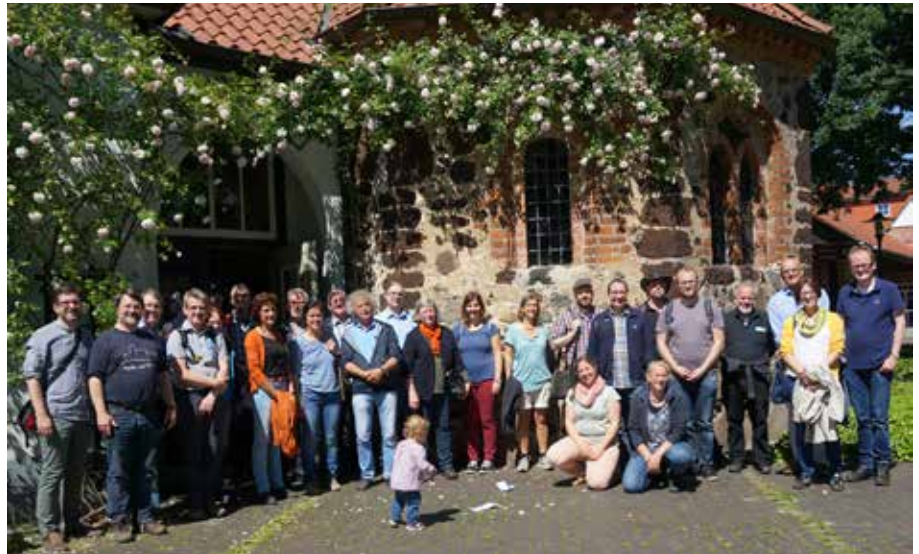
Gruppenbild unter den Kletterrosen der alten Kapelle in Engensen.