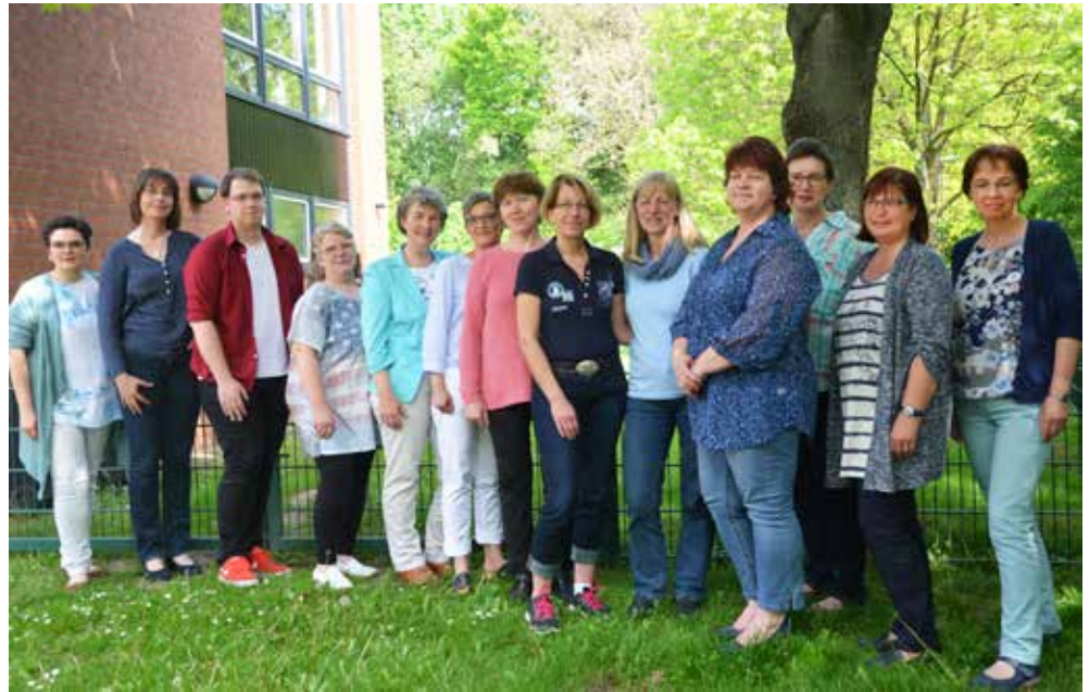
Mit ersten Erfahrungen zur Umsetzung der Standards für Gemeindebüros beschäftigten sich die Pfarramtssekretärinnen während ihres Jahrestreffens in der Elia-Gemeinde.

„Das Einbringen der Handlungsempfehlungen in den KV wird von Monat zu Monat verschoben“, bedauerte eine Gemeindesekretärin, während eine andere berichten konnte, dass in ihrem Büro bereits Schreibtisch, Stuhl und PC ersetzt wurden. „Die Kirchenvorstände haben