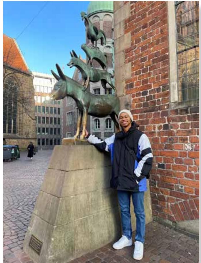
Ausflug nach Bremen.

Wenn du zurückblickst – würdest du die Entscheidung für den Freiwilligendienst wieder treffen?